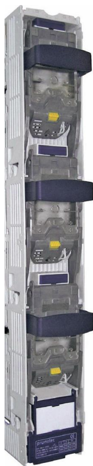
BTVC висувна ручка