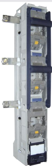
BTVC-DT 2 ручки та боковий ввід