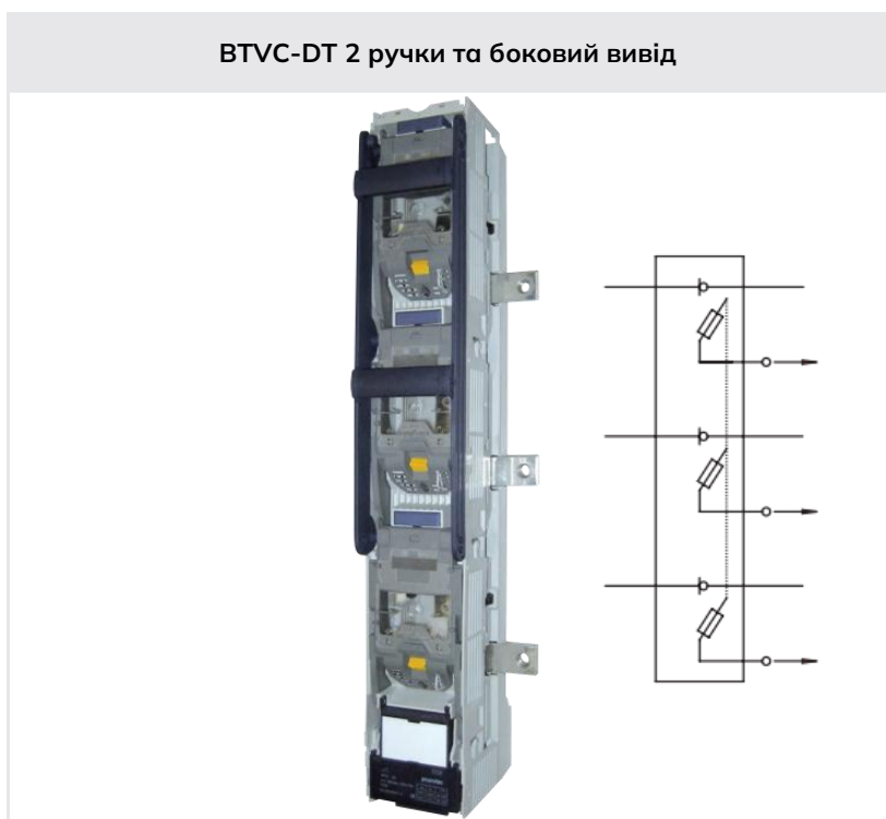
BTVC-DT 2 ручки та боковий вивід