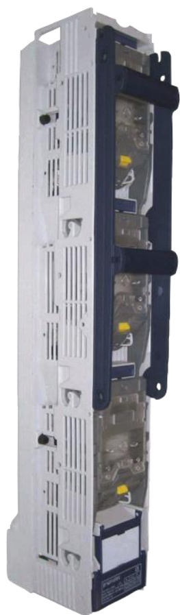
BTVC-DT 2 ручки