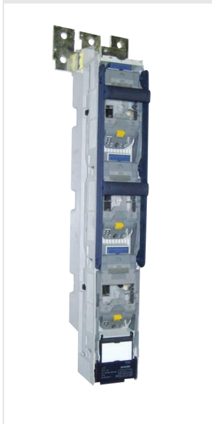
BTVC-DT 2 ручки та вверхе підключення